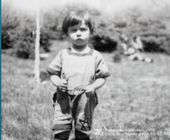
René Lévesque au pique-nique, 1925

VOUS DÉSIREZ, VOUS AUSSI, PARTICIPER À CET HOMMAGE ? SOYEZ LES BIENVENUS!